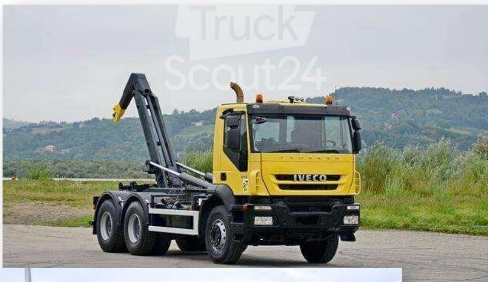
Fig 4. Kamion për spostimin e bluajtësit