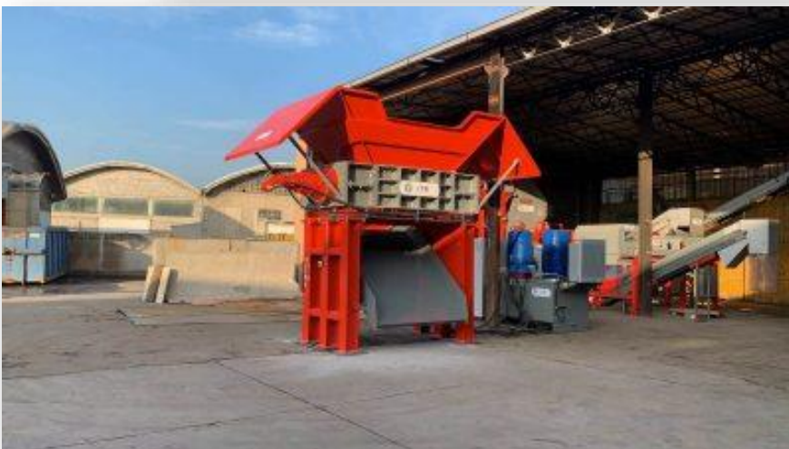
Fig. 2. Bluajtës i fiksuar