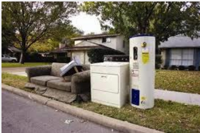
Fig. 6. Sistemimi i mbetjeve voluminoze përpara banesës

Pajisjet për trajtimin e mbetjeve voluminoze