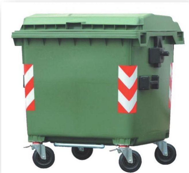
Fig. 7. Kontejner 1.100 litra për depozitimin e materialit të bluajtur