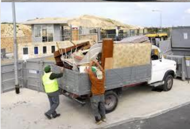
Fig. 5. Kamion për transportin e mbetjeve voluminoze