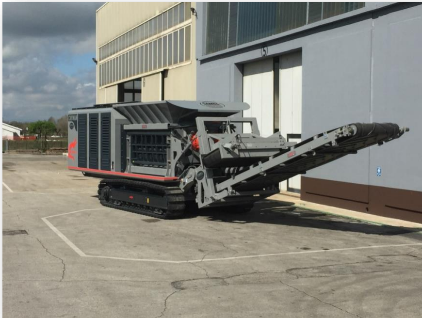
Fig 1. Bluajtës vetëlëvizës me zinxhirë

Është e rëndësishme të theksohet që sistemet e lëvizjes nuk ndikojnë fare mbi performancën e bluajtësve, të cilët janë të pajisur me lama dhe rotorë identikë me ata të bluajtësve të fiksuar. Aftësia prerëse, polivalenca dhe efiçenca mbeten gjithmonë të njëjtat si ato të një bluajtësi të fiksuar, por këtyre veçorive u shtohen edhe avantazhe të tjerë të shumtë nga pikëpamja organizative dhe logjistike.